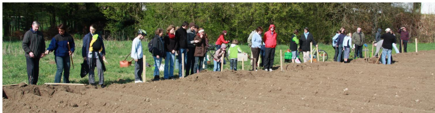
STARNBERGER LAND Sonnenacker-Pächter übernehmen ihren Bifang